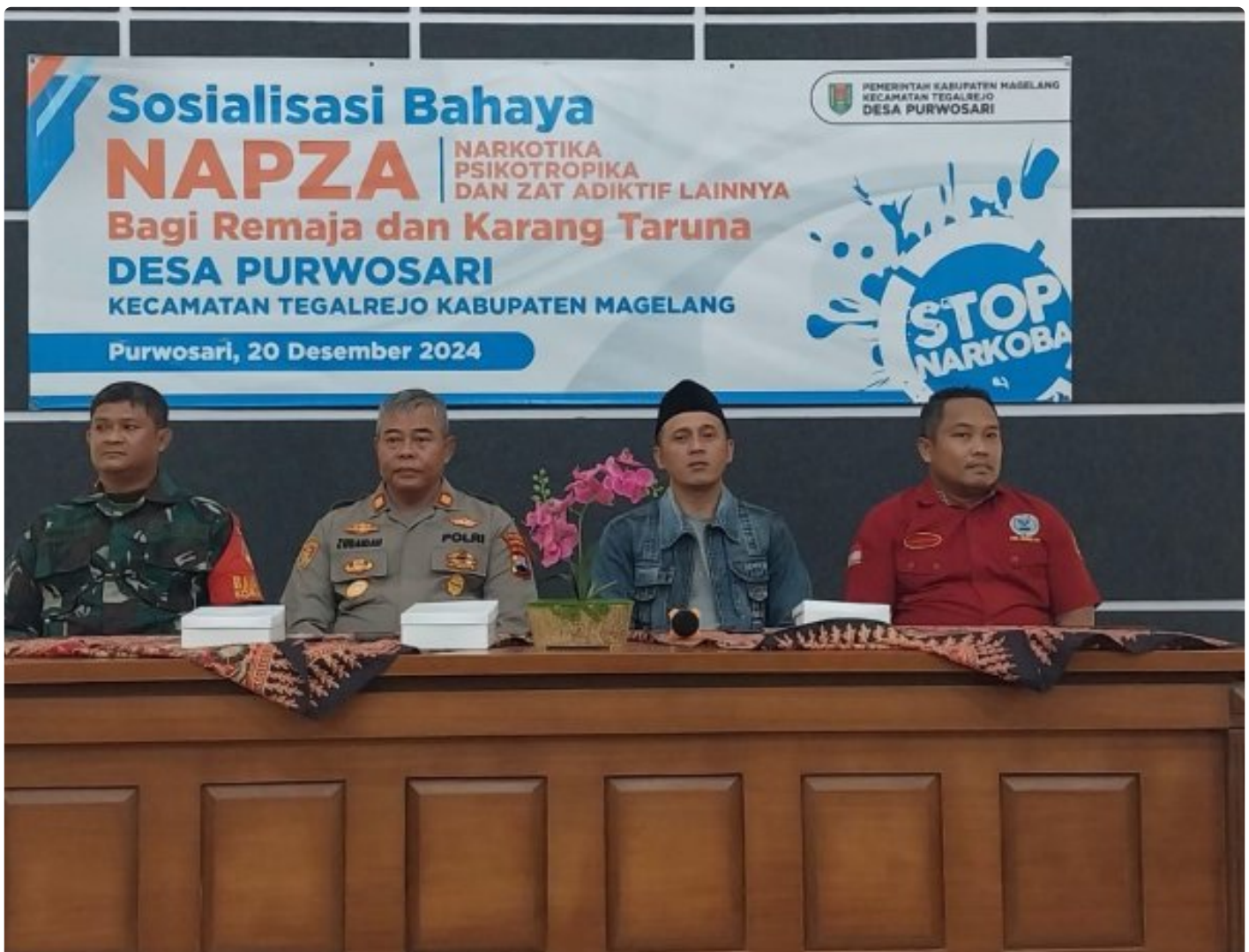
(Foto Dokumen) : Kegiatan sosialisasi bahaya narkoba dan kenakalan remaja

MAGELANG - Anggota Koramil 09/Tegalrejo bersama Polsek setempat dan